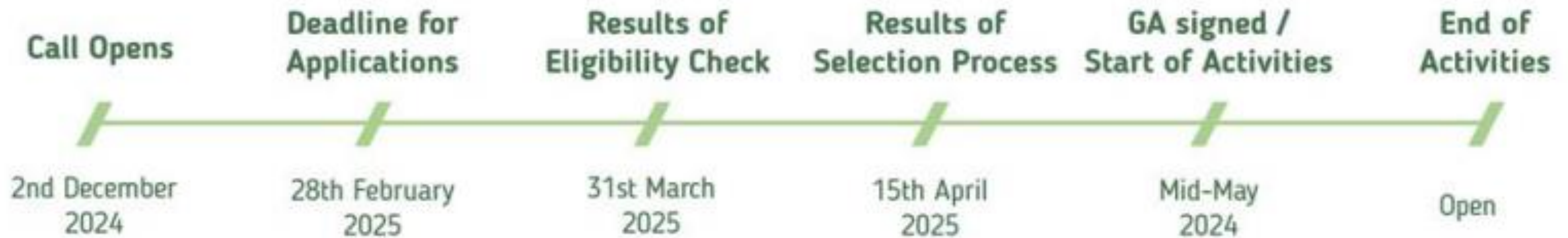
Figure 1: Expected timings for key milestones in the EENergy Open Call